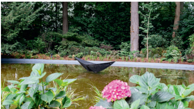
La sculpture à base de bouteilles de Badoit de Tatiana Wolska, et, à l'arrière-plan, la sculpture cloutée du Finlandais Antti Laitinen créée, l'été dernier, avec les visiteurs du parc Tournay-Solvay.