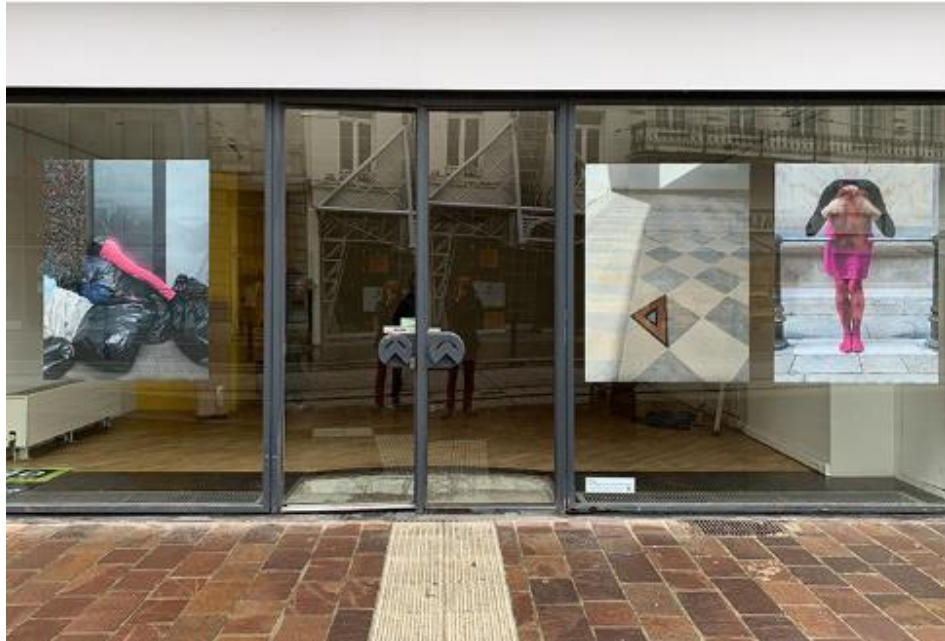
Triage © Lieve D'hondt

Net zoals veel steden staan ook in Gent een aantal winkelpanden leeg. Die lege vitrines kan je mistroostig vinden, maar een kunstenaarstrio bestaande uit Maria Degrève, Lieve D'hondt en Freya Maes zag er vooral een kans in om hun werk tentoon te stellen. Ze ontwikkelden een parcours doorheen Gent waarbij de ramen van leegstaande panden veranderen in kleine pop-upmuseums. De montages in de vitrines zijn 24 uur op 24 en 7 dagen op 7 te bekijken vanop straat en blijven aanwezig zolang het pand leegstaat.