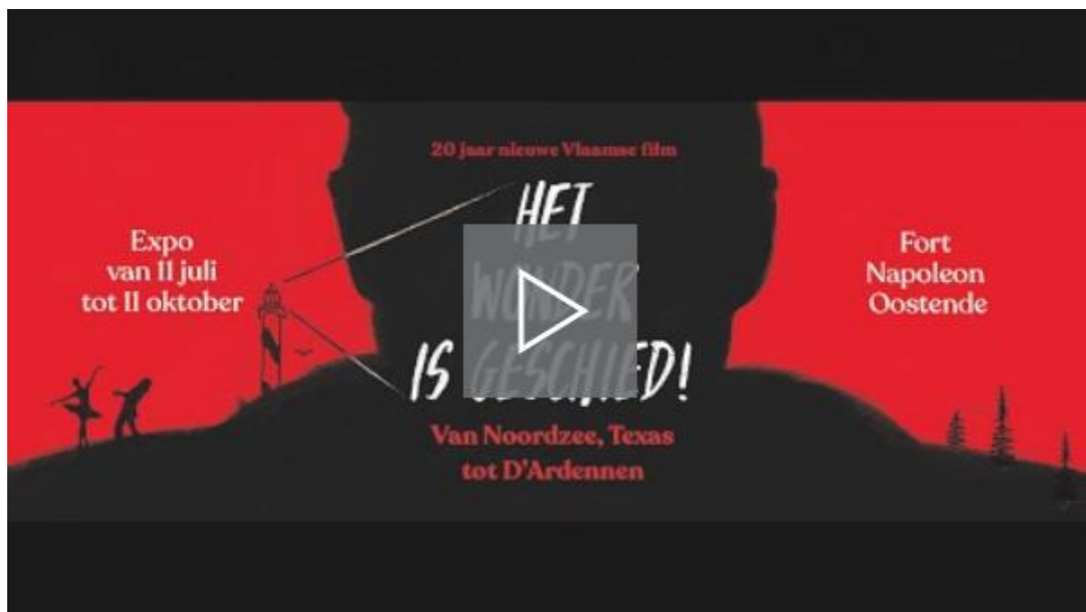
Het wonder is geschied! – Trailer

'Het wonder is geschied!' , tot 11 oktober, Fort Napoleon in Oostende.