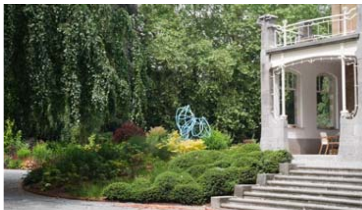
Tinka Pittoors répond à l'architecture Horta avec une création tout en volutes... © AURÉLIE GRAVELAT